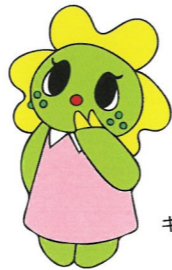
石川高校 マスコット キャラクター 「菜ノ」